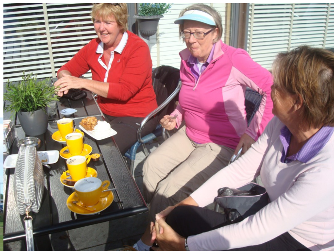
Eerst even koffie