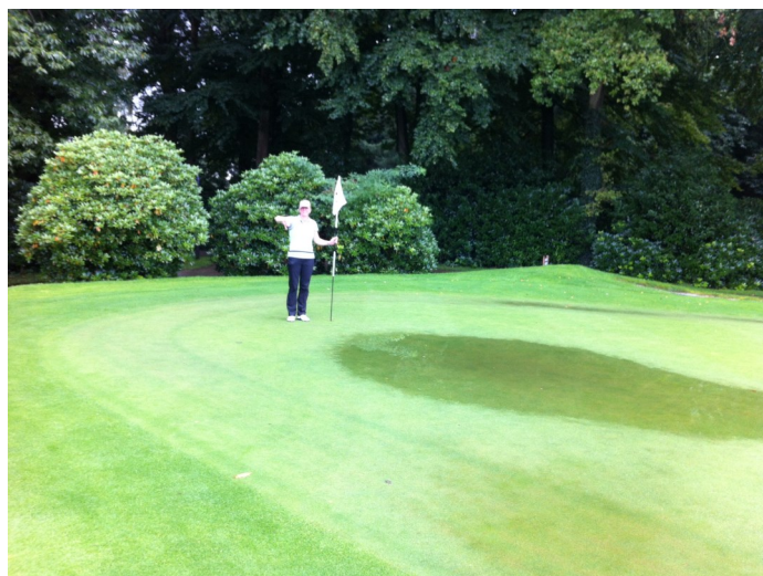
Hole 9 na een flinke stortbui.

Geen Orlando, maar wel een weekendje op stap met de AGV naar Nijmegen!