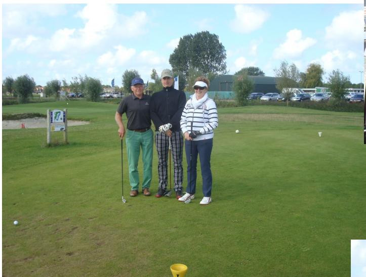
Klaar voor de jacht