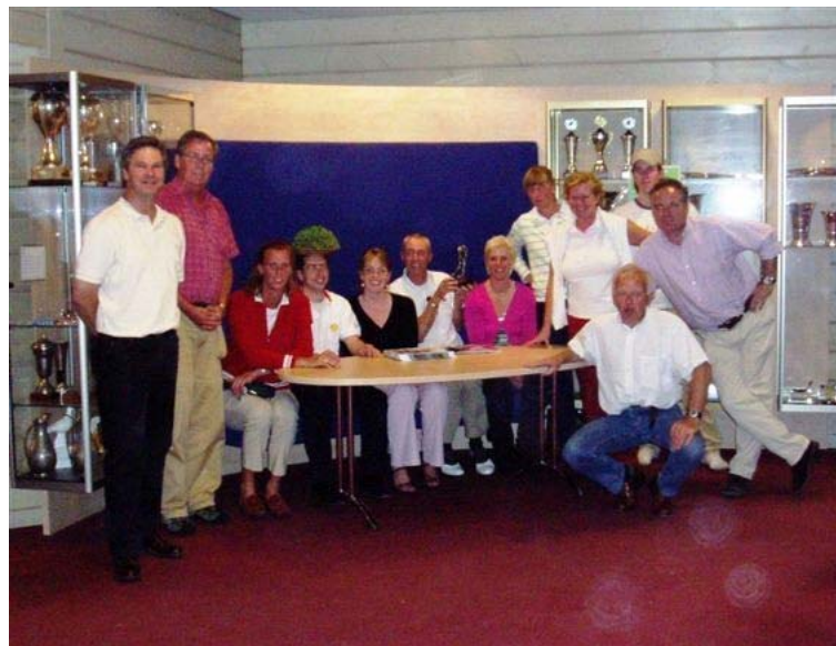
(een deel van het Shell/SRTCA & partners team)

Nogmaals: allemaal hartelijk bedankt voor inzet en bijdrage aan het succes van het Shell/SRTCA & partners team!